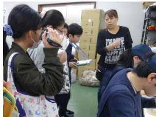
作業を見学し、丁寧な仕事に驚く

今年度が初めての取組となるLEDライトに関係する人々への取材を行った。LEDライト本体は「ファースト」という福祉施設で作られていることがわかり、現場に向かった。作業工程をビデオに収録しながら、一つ一つ手作業で心を込めて作っている方々の真剣な表情に子どもは引き込まれていった。