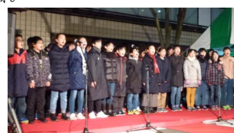
心を込めた二部合唱

心を込めた歌声に思わず涙が出ました。特に歌詞の中の「10年後も、20年後も」のメッセージに感動しました。これまでの取組の発表も内容が濃く、調査や取材をよくしていたことが分かりました。子どもは大人の世話になるのが普通ですが、今回は逆に子どもたちから地域に貢献してもらえて、それが街の活性化につながっているのを見て、胸がいっぱいになりました。