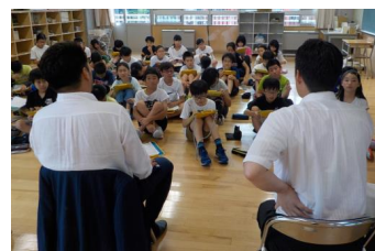
正副実行委員長の話を聞く

今春、6年生に進級した子どもたちは、まず、これまでの歴史を知ろうと、4代目となる光のページェント実行委員長や副委員長、現在、大学生となっている先輩（2010年度卒業）、過去に6年生の指導に当たった教諭等に話を聞いた。