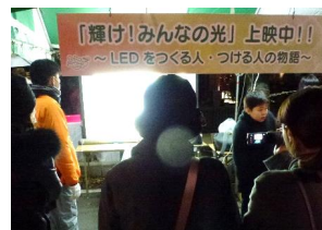
LEDに関わる人々のビデオ上映