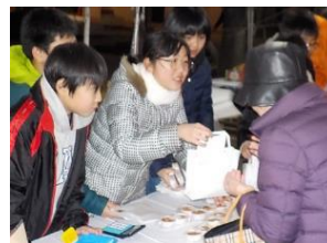
専門学校と協働したマドレーヌ販売

拍手が寄せられた。セーフティスタッフとして巡視をしながら参観していた地域の方は、後日、以下のような感想を寄せてくださった。